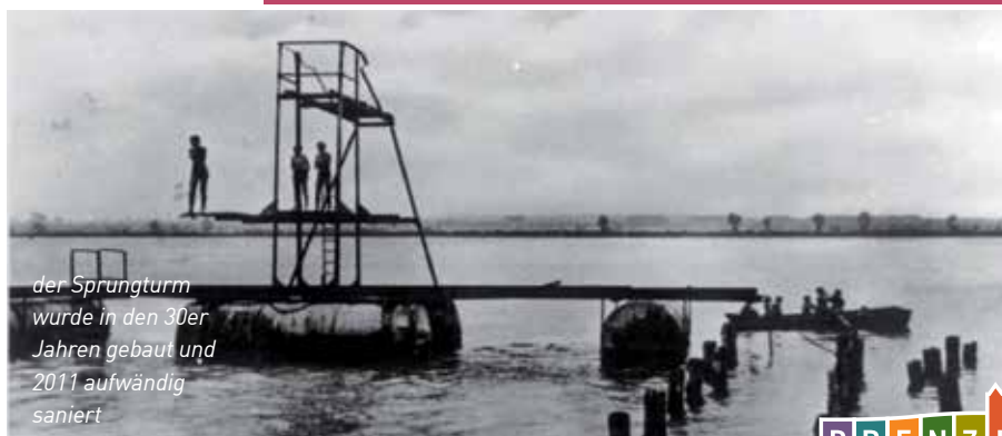
der Sprungturm wurde in den 30er Jahren gebaut und 2011 aufwändig saniert